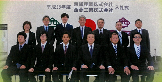
平成28年度 西條産業株式会社 入社式 西菱工業株式会社