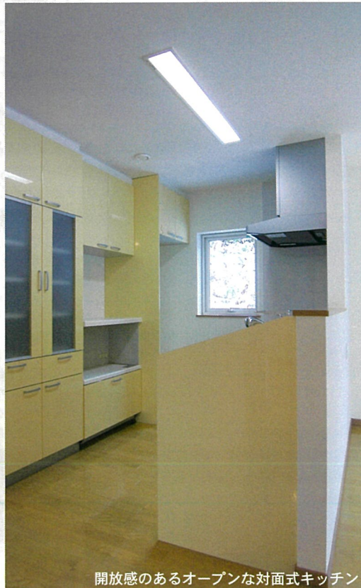
開放感のあるオープンな対面式キッチン