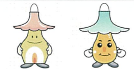
あかりんちゃん いーべやくん

2月15日～18日に小樽市「おたる移住・交流推進事業研究会」が行った本州からの移住体験ツアーのプログラムにて、当社のモデルハウスが利用され北海道の住宅の構造や性能についての説明をさせて頂いたほか、実際に当社がお手伝いした移住のお客様の事例など、ツアーに参加された方は興味深く聞き入っていました。