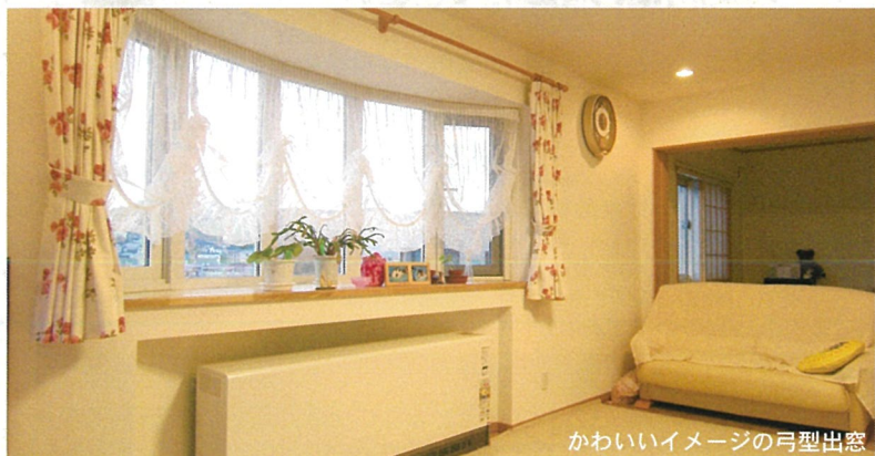
かわいいイメージの弓型出窓