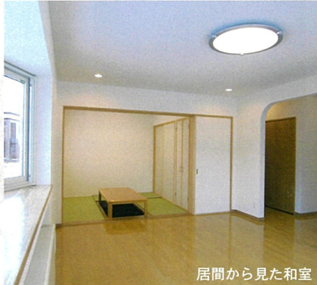
居間から見た和室